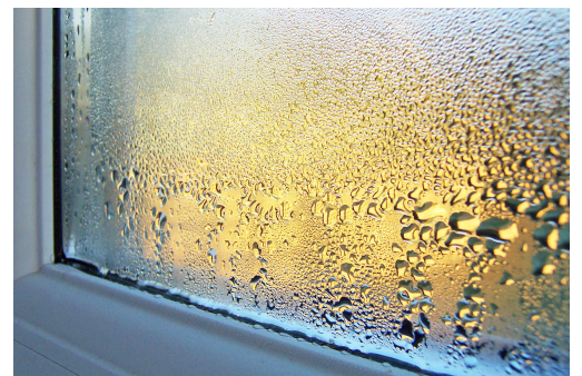
Kondenswasser an einer Fensterscheibe

einem halben Liter Wasserdampf ausscheiden. Dazu kommen die Feuchtigkeit aus Küche und Bad sowie mangelnde Luftkonvektion am Fenster. Mit zunehmend feuchter Raumluft steigt deshalb auch die Gefahr der Kondensation an Fenstergläsern und Wänden, speziell auf kalten Oberflächen.