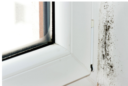
Schimmelbildung bei Fenstern

Richtiges Lüften mindestens zweimal am Tag hilft, hohe Luftfeuchtigkeit und starke Abkühlungen von Bauteilen sowie grosse Energieverluste zu vermeiden. Falls Heizkörper vorhanden sind, sollten diese während der Lüftungsdauer abgestellt werden. Ziel beim Lüften ist es, einen kompletten Luftwechsel vorzunehmen. Dies fördert ausserdem eine gute Raumluftqualität. Speziell im Winter sollte auf gekippte Fenster als alleinige Lüftungsvariante verzichtet werden. Gekippte Fenster begünstigen das Abkühlen der Bauteile und Oberflächen im Fensterbereich, was wiederum die Schimmelbildung fördert. Ausserdem geht durch ein dauerhaft gekipptes Fenster zu viel wertvolle Heizenergie verloren.