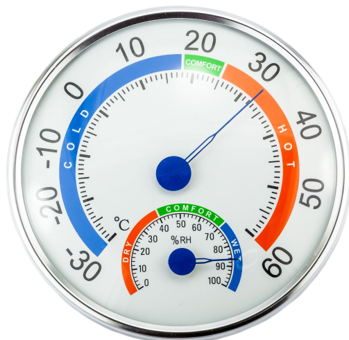
Hygrometer zur Bestimmung von Temperatur und Luftfeuchtigkeit

Die optimale Überwachung des Wohnungsklimas kann mit einem einfachen Hygrometer sichergestellt werden.