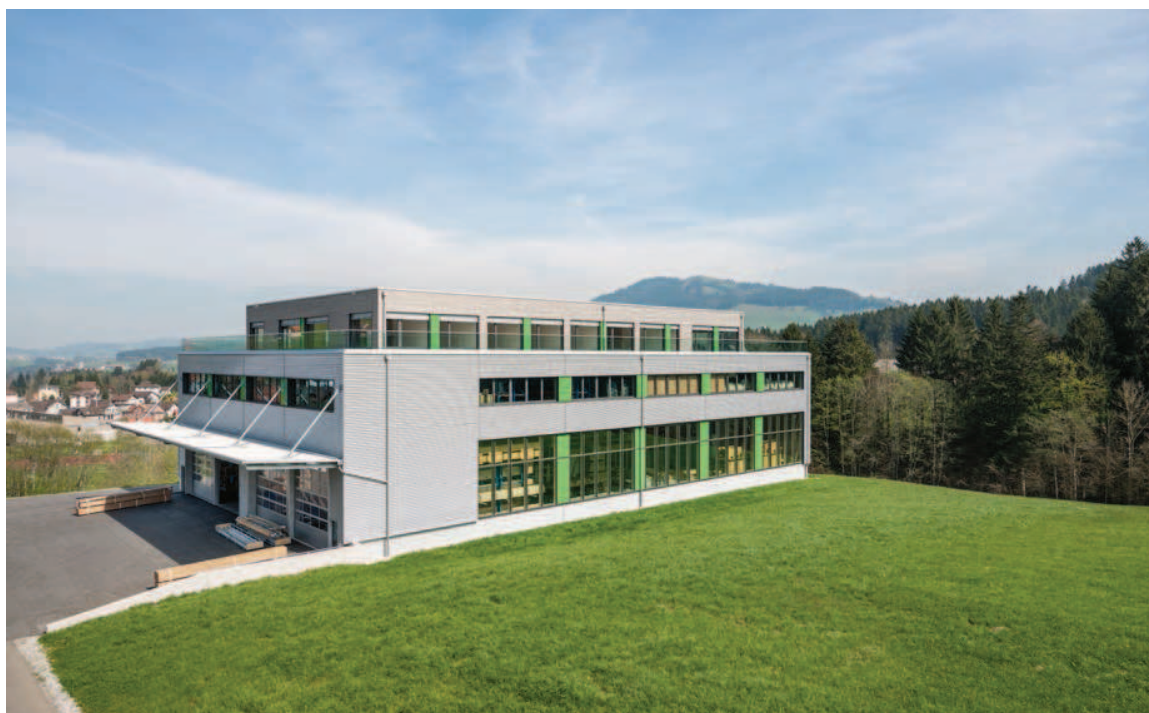
Die Blumer Techno Fenster AG bietet die ganze Gebäudehülle an. Ihre Glasfassade hat sie gleich im eigenen Werk produziert.