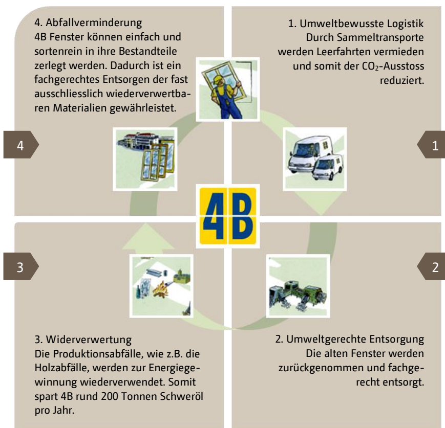
Das 4B Recycling-System basiert auf vier Pfeilern